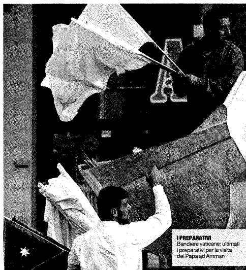
I PREPARATIVI Bandiere vaticane: ultimati i preparativi per la visita del Papa ad Amman

Ma sulla stampa israeliana cento rabbini lo salutano: "La sua presenza aiuterà il dialogo"