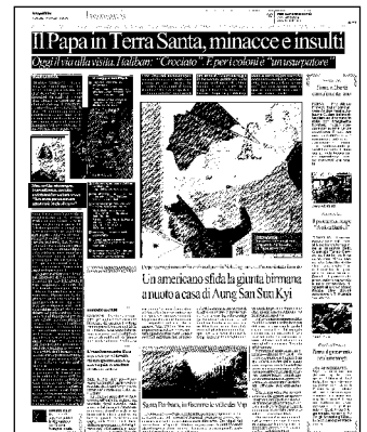
I PREPARATIVI Bandiere vaticane: ultimati i preparativi per la visita del Papa ad Amman